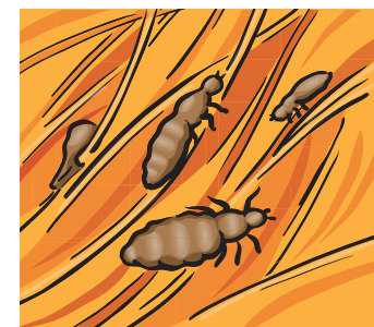
3 stádia života vši: hnida (=vší vajíčko), larva a dospělá veš