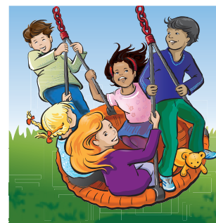
JUPÍ, vši jsou PRYČ!