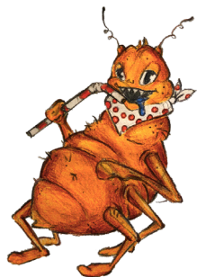
VEŠ za svůj život snese až 300 vajíček (10/den).