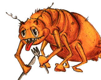
VEŠ neskáče, leze z hlavy na hlavu.