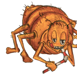
VEŠ saje krev, bez krve nepřežije 24 h.