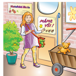
VŠI se daří v dětských kolektivech