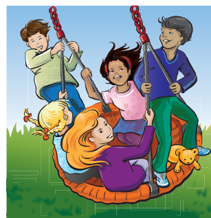
JUPÍ, vši jsou PRYČ!