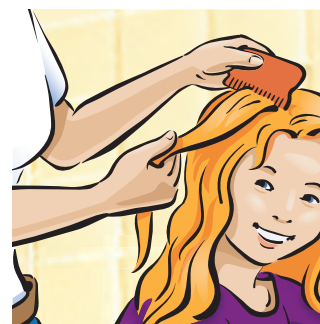
Důležitá je RYCHLOST a zastavení ŠÍŘENÍ.