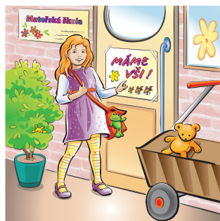
VŠI se daří v dětských kolektivech

Zde odstříhnete a použijte ke hře. Informační část letáku můžete uchovat pro další použití.