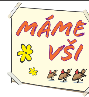
Nebojte se, existuje rychlé řešení.