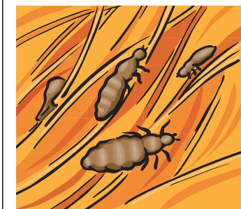
3 stádia života vši: hnida (=vší vajíčko), larva a dospělá veš