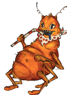
VEŠ za svůj život snese až 300 vajíček (10/den).